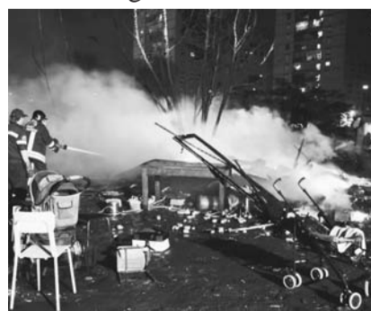
Alltag in Italien: Illegal vom Balkan eingereiste Roma beim Registrierungsversuch.

Komitee gegen die Ausdehnung der Personenfreizügigkeit auf Rumänien und Bulgarien, Postfach 8252, 3001 Bern Mit einer Spende auf PC 60-167674-9 unterstützen Sie dieses Inserat. Mit herzlichem Dank.