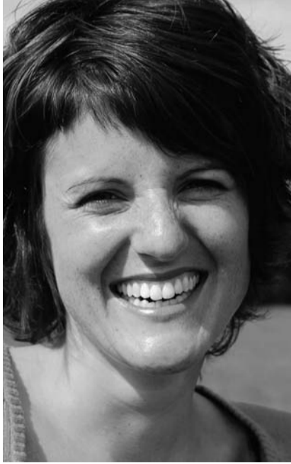
Geboren 1978, wohnhaft in Eichberg SG. Seit 2003 Mitglied des Nationalrats, SVP. Unternehmerin im Baumaschinen-Handel.

Die Wohlstandsunterschiede zwischen den beiden neuen EU-Ländern Rumänien und Bulgarien einerseits, der Schweiz andererseits sind riesig. Der gesetzliche Monats-Mindestlohn für einen Vollzeitjob beträgt in Rumänien