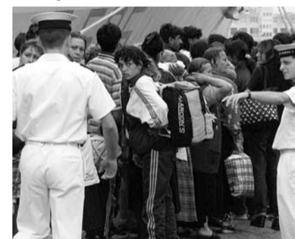
«Hinterlassenschaft» einer illegalen Roma-Siedlung bei Neapel.