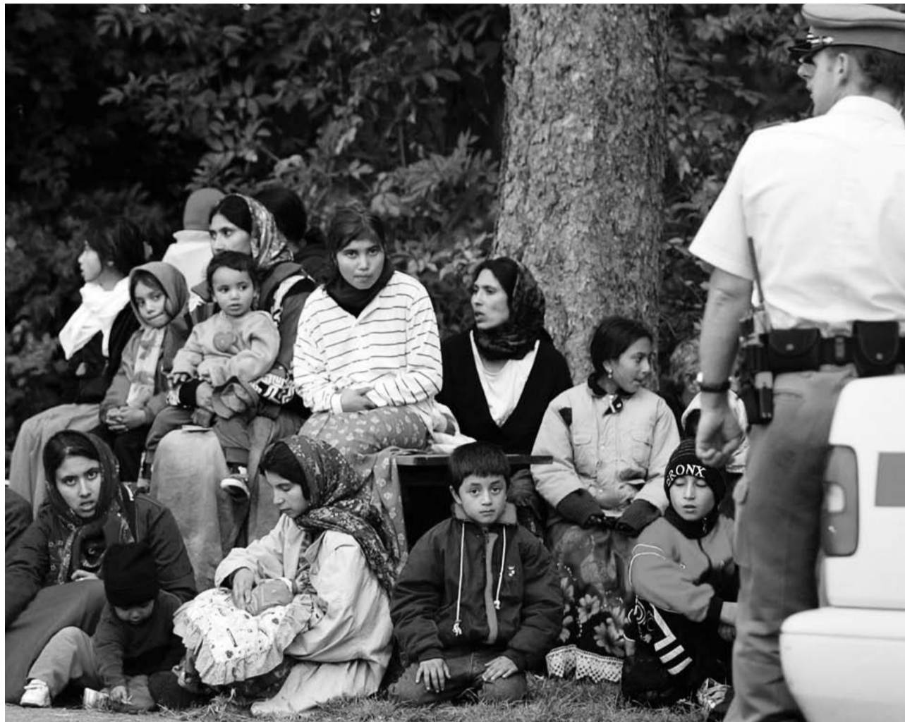
Auch im Kanton Waadt werden bereits illegal eingereiste Roma-Sippen aufgegriffen. Wenn die Personenfreizügigkeit Tatsache wird, dürften Zuwanderungen fast unmöglich werden.

Frage: Wie äussert sich das «Roma-Problem» in Rumänien?