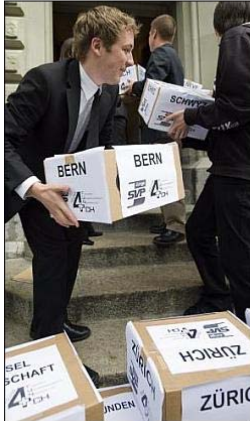
Sorgen für Ungemach: Der junge SVP-Nationalrat Lukas Reimann übergibt gestern die Unterschriften der Bundeskanzlei.

Obwohl die Parteileitung und einige SVP-Parlamentarier über das Referendum der wilden Jungpartei nicht erfreut sind, erhalten sie Lob von den gestandenen Parteikollegen: «Ich bin stolz auf unsere Jungen», sagt Giezendanner. Sie hätten mit dem Referendum eine gute Leistung gezeigt. Und auch Jenny muss zugeben: «Das Referendum ist ein Erfolg der Jungen SVP. Das muss ich anerkennen.»