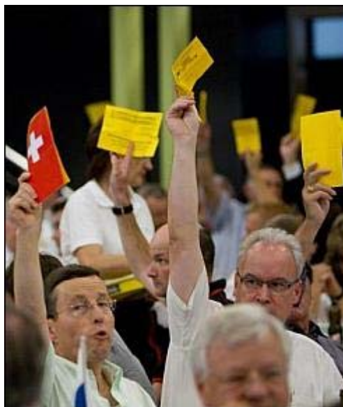
Gespaltene SVP: Ein Drittel der Delegierten sprachen sich am 5. Juli in Brig für das Referendum aus.